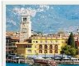
Riva del Garda

Colazione e partenza per Riva del Garda. La cittadina sorge all'estremità settentrionale dell'omonimo lago, dove l'acqua incontra pareti rocciose e verdi pendii. Il clima è mite, segnato da ulivi, limoni e palme, il centro storico conserva torri, chiese e palazzi che raccontano secoli di storia. Pranzo in ristorante tipico. Pomeriggio libero. In tarda serata, proseguimento per Linate, per l'imbarco sul volo di ritorno. Arrivo alle rispettive destinazioni, sbarco e fine dei nostri servizi.